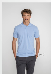
PRIME MEN 00571